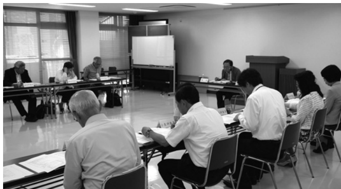
公益財団の運営について審議する評議員の皆さん