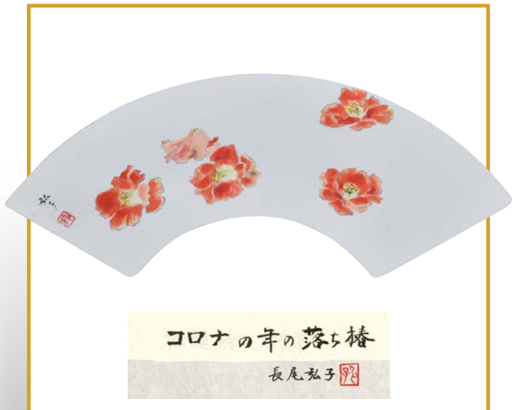
90歳を迎え、新型コロナウイルスの収束を自宅庭の落ち椿に託して描きました。